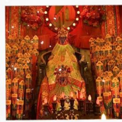
เจ้าแม่กวนอิมวัดสองอ่า