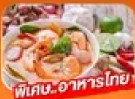
พิเศษ! อาหารไทย