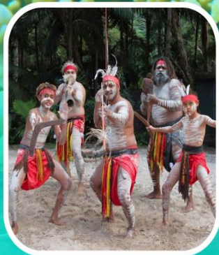
Rainforestation Aboriginal Show