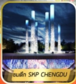
ตึก SKP CHENGDU