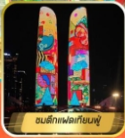
ตึกแฟลทเทียนฟู