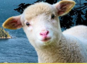
หมู่บ้านเมารี อาหารสไตล์ชาวเมารี แบบแท้จริง