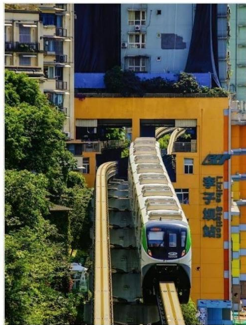
รถไฟฟ้าวิ่งทะลุตึก