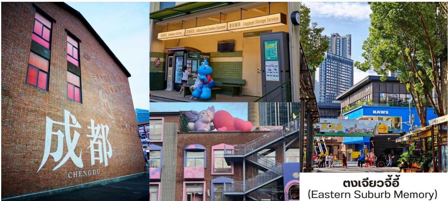
ตงเจียวจี้ (Eastern Suburb Memory)

จากนั้นนำท่านชม ตงเจียวจี้ (东郊记忆, Eastern Suburb Memory) หนึ่งในสถานที่ท่องเที่ยวที่โดดเด่นและเป็นที่ยอดนิยมที่สุดในเจิงตู ที่นี่เคยเป็น อดีตโรงงานผลิตหลอดอิเล็กทรอนิกส์ในยุค 1950s สถานที่เที่ยวในเจิงตูที่ ผสมผสาน ศิลปะ วัฒนธรรม ไลฟ์สไตล์ การช้อปปิ้ง และอาหาร ไว้ในที่เดียวจากอดีตโรงงานอุตสาหกรรมที่ถูกแปลงโฉมเป็นแหล่งแฮงเอาต์สุดฮิป เมื่อคุณก้าวเข้าสู่ตงเจียวจี้ จะสัมผัสได้ถึงบรรยากาศที่เต็มไปด้วยเอกลักษณ์ของสถาปัตยกรรมแบบ Industrial Chic ที่นี้เต็มไปด้วยองค์ประกอบของโรงงานเก่า เช่น โรงงานอิฐสีแดง โกดังขนาดใหญ่ ปล่องไฟสูง ท่อน้ำและหัวรถจักรไอน้ำเก่า ที่ตั้งอยู่ตามจุดต่าง ๆ ซึ่งกลายเป็นฉากหลังยอดนิยม สำหรับนักท่องเที่ยวที่ชื่นชอบการถ่ายภาพ โดยมีไฮไลท์ที่น่าสนใจตามโซนต่างๆ อาทิเช่น Concept Stores & Handmade Shops ร้านเสื้อผ้าและของที่ระลึก สไตลอินดี้ งานทำมือที่ไม่ซ้ำใคร Bookstores & Creative Shops ร้านหนังสืออิสระที่มีทั้งงานศิลป์ ไปสการ์ด และของสะสมแนววินเทจ Souvenir Corner – ของฝากเก๋ ๆ เช่น เครื่องประดับงานคราฟต์ กระเป๋าผ้า ลายกราฟิก แนวศิลปะ Cafés เก๋ ๆ – มีทั้งคาเฟ่ในโกดังอิฐแดง คาเฟ่กาแฟไปจนถึงร้านชาแบบโมเดิร์น บาร์ & คราฟต์เบียร์ – ตอนเย็นบรรยากาศคึกคัก เหมาะกับการนั่งชิลฟังดนตรีสด อาหารเสฉวน (Sichuan Food) ร้านอาหารท้องถิ่น จัดเต็มเมนูเผ็ดร้อน เช่น หม่าล่าหม้อไฟ เสฉวนสตรีทฟู้ด สตรีทฟู้ดสไตล์ครีเอทีฟ – เช่น ไอศกรีมโฮมเมด ขนมอบ แชนด์วิชพิวซัน และของกินเล่นที่เหมาะกับการเดินช้อปปิ้งเพลิน ๆ