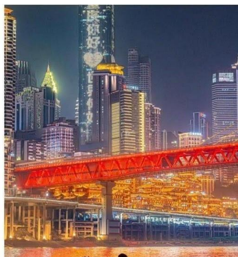
หงหย่าต้ง

คำ บริการอาหารคำ ณ ภัตตาคาร เมนูพิเศษ...สุกี้ฉงชิ่ง