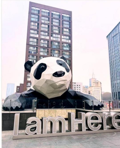
หมีแพนด้ายักษ์ กำลังปีนตึก IFS