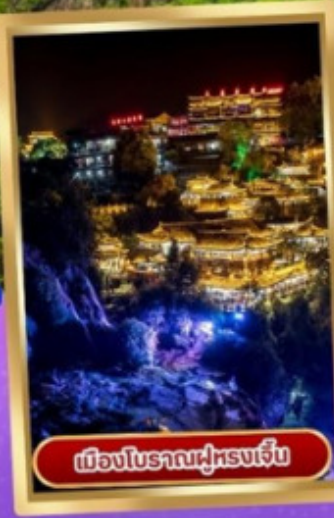
เมืองโบราณฝูหรงเจิ้น