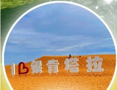
ทะเลทรายอินเคินทาลา