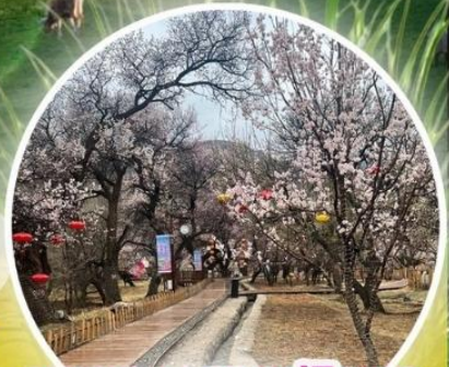
หุบเขาดอกแอปเปิ้ล

ทุ่งหญ้าซิลามูเหริน - พิธีการขอพรจากไอวเฮา - ปาร์ตี้กองไฟ - หมู่บ้านชนเผ่ามองโกล สวนวัฒนธรรมมองโกลเหมิงเสียง - หุบเขาดอกแอปเปิ้ล - ทะเลทรายอินเคินทาลา แหล่งวัฒนธรรมมองโกลหยวนหลิว (รวมรถกอล์ฟ 2 ขา) - ตลาดกลางคืนเจียไท่ สวนวัฒนธรรมการแต่งงานสุดเอ็กซ์คลูซีฟแห่งเดียวในประเทศจีน บ้านองค์ปฐม - เซตการท่องเที่ยวเจงกิสข่าน-ถนนคนเดินคังปาซือ