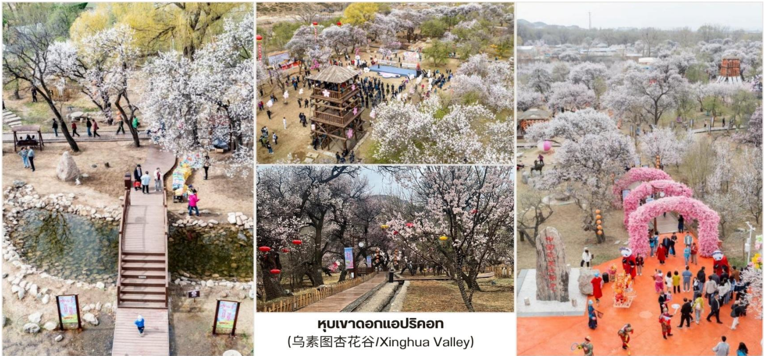
หุบเขาดอกแอปริคอต (乌素图杏花谷/Xinghua Valley)

บ่าย นำท่านชม หุบเขาดอกแอปริคอต (乌素图杏花谷/Xinghua Valley) หรือ "ชิงฮวาถู" เป็นหุบเขา ที่พื้นที่บริเวณดังกล่าวเต็มไปด้วยต้นแอปริคอต และเมื่อคราวใดก็ตามถึงช่วงเวลาที่ดอกแอปริคอตเบ่งบาน หุบเขาแห่งนี้จะถูกปกคลุมไปด้วยสีชมพูแสนหวาน จนทำให้สถานที่แห่งนี้เป็นหนึ่งในแลนด์มาร์กดึงดูดนักท่องเที่ยวให้ เดินทางไปชมภูเขาสีชมพูด้วยตาตัวเอง