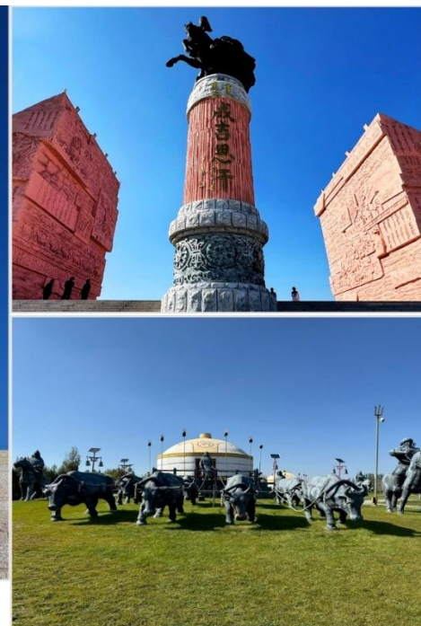
เขตท่องเที่ยวเจงกิสข่าน • กลุ่มประติมากรรม กองทัพเหล็กและกระโจมทอง