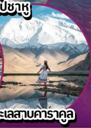
ทะเลสาบคาราคูล

เช็किनไฮไลท์เด็ด น้ำหนักกระเป๋า 20 KG พักโรงแรม 4 ดาว