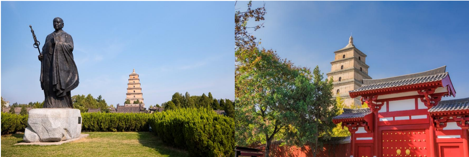
กว่าพันเล่ม

จากนั้นนำท่านเดินทางสู่ เจดีย์ห่านป่าใหญ่ แห่งวัดฉือเอิน สร้างเสร็จในปีค.ศ. 652 โดย ถังเกาจง(หลี่จื้อ) ย่องเต๋องค์ที่สาม แห่งราชวงศ์ถัง และ ได้นิมนต์พระภิกษุสวนจั้ง หรือรู้จักในนามพระถังซัมจั๋ง พระเถระที่มีชื่อเสียงที่สุดในสมัยถัง ซึ่งใช้เวลากว่า 15 ปีจาริกไปถึงอินเดียและได้นำพระธรรมคำสั่งสอนในพระพุทธศาสนา กลับมาเผยแผ่ในแผ่นดินจีนให้มาอยู่ที่วัดฉือเอินแห่งนี้พระถังซัมจั๋งได้ใช้เวลาออกแบบและร่วมสร้างเจดีย์ห่านป่าใหญ่ในวัดฉือเอินเพื่อใช้ในการเก็บรักษาพระไตรปิฎก ที่ท่านได้นำมาจากอินเดียและแปลเป็นภาษาจีนนับจำนวน