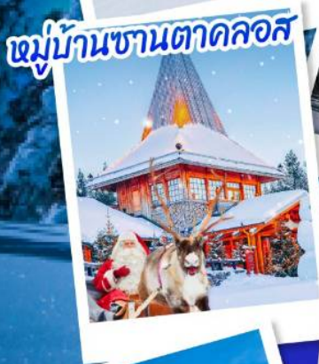
หมู่บ้านซานตาคลอส