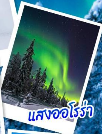
แสงออโรรา