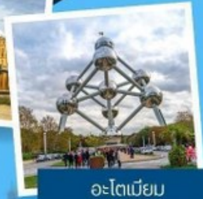
อะโตเมียม

สวิตเซอร์แลนด์ ฝรั่งเศส เบลเยียม เนเธอร์แลนด์ 8 วัน