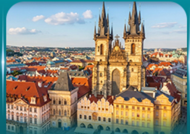
ชมปราสาทปราท ย่านเมืองเก่า