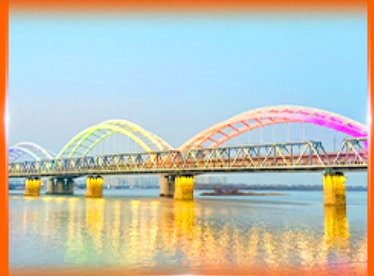
สะพานรุทโพปินโจว