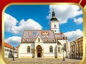
โบสถ์เซนต์มาร์ก ซาเกรบ