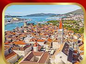
มหาวิหารเซนต์ลอว์เรนซ์