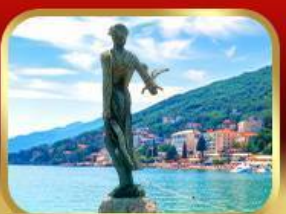
ราชินีแห่งอาเดรียติก โอฟาเทีย