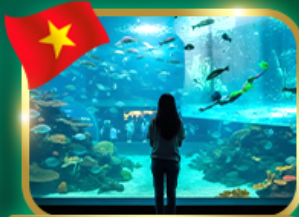
The Sea Shell Aquarium