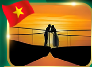
ชมอาทิตย์ตก ณ สะพานจู