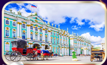
พิพิธภัณฑ์ฮอร์มิก้า