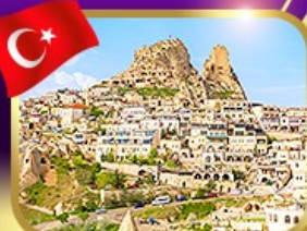
หุบเขาอูซึซาร์ คัปปาโดเกีย