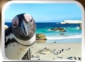
Simon's Town ชมนกเพนกวินสุดน่ารัก