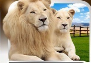
เข้าชมสวนเสือแบงโกลิซิด The Lion Park