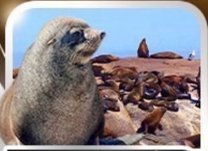
ล่องเรือชมฝูงแมวน้ำ ณ Seal Island

ตะลุยซาฟารี อุทยานสัตว์ป่าหุบเขาพิลาเนเบิร์ต