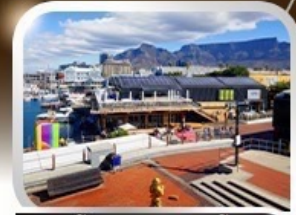
ช้อปปิ้งท่าเรือแบรนด์ชั้นนำ V&A waterfront