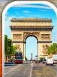
ARC DE TRIOMPHE FRANCE