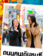
ถนนคนเดินชุนชี่