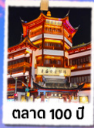
ตาด 100 ปี