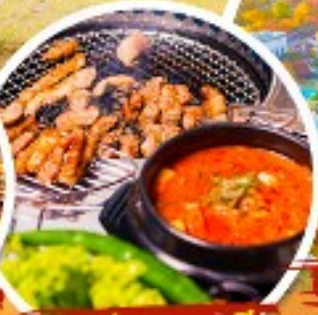
ตัวอย่างเกาหลี