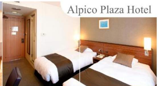
Alpico Plaza Hotel