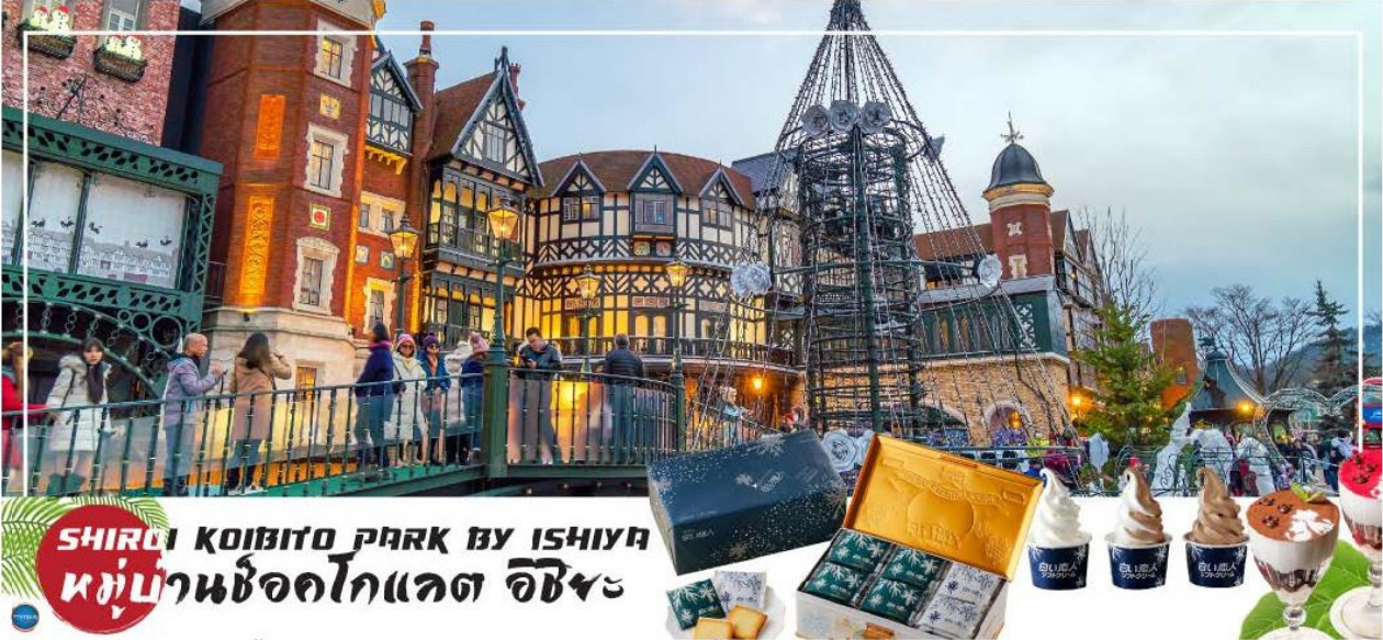
SHIROI KOIBITO PARK BY ISHIYAKI หมู่บ้านช็อคโกแลต อิชียะ

โกแลตที่ขึ้นชื่อที่สุดของที่นี่คือ Shiroi Koibito ซึ่งมีความหมายว่าช็อคโกแลตขาวแต่คนรัก ท่านสามารถเลือกช็อคกลับไปให้คนที่ท่านรักทานหรือว่าซื้อเป็นของฝากติดไม้ติดมือกลับบ้านก็ได้ นอกจากนี้ท่านจะได้เลือกซื้อช็อคโกแลตที่หาซื้อที่ไหนไม่ได้ และ ท่านก็ยังจะได้ชมประวัติความเป็นมาของโรงงาน และการผลิตช็อคโกแลตอีกด้วย