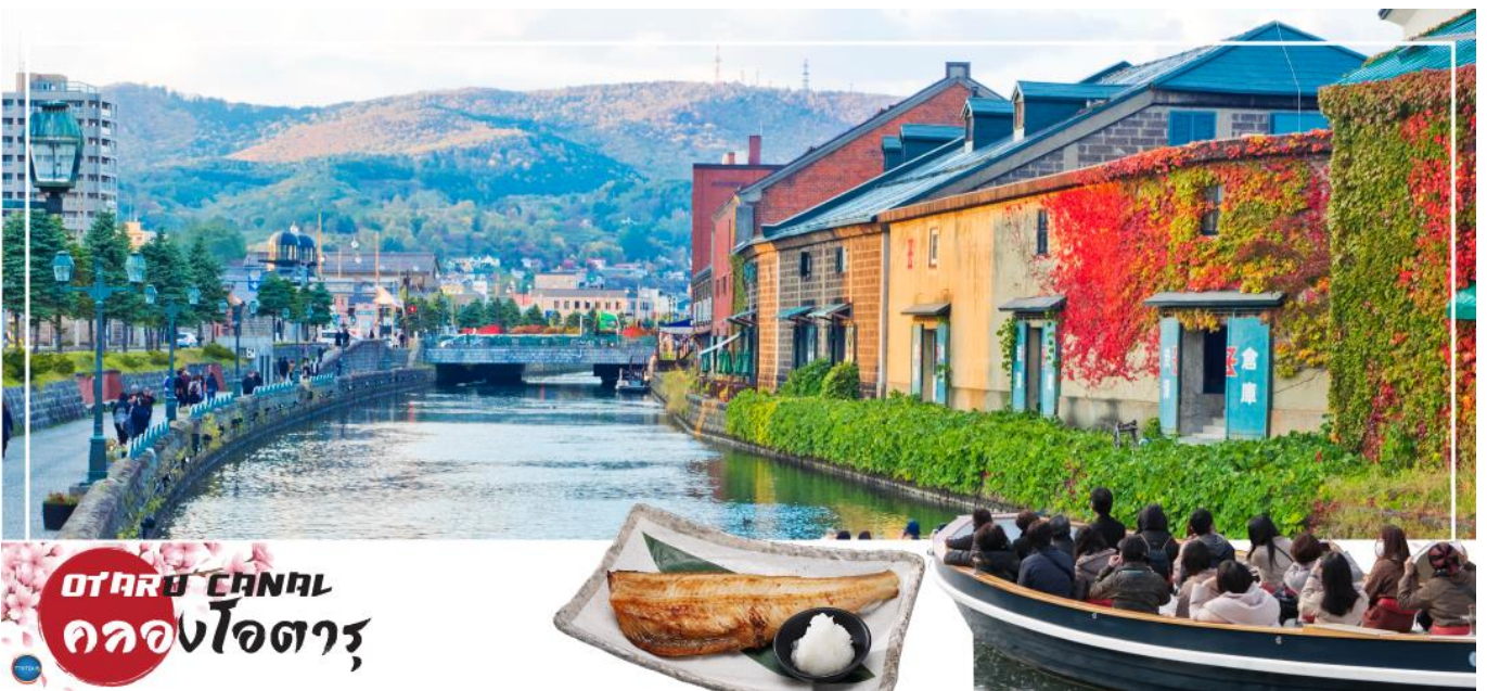
OTARU CANAL คลองโอตารุ

เมืองซัปโปโร – ดิวตี้ฟรี – เมืองโอตารุ – คลองโอตารุ – พิพิธภัณฑ์กล่องดนตรี – เมืองซัปโปโร – ศาลาว่าการเมืองซอกไกโดหลังเก่า (ด้านนอก) – ผ่านชม หอนาฬิกาเมือง – ซ้อปปิ้งทานุกิโคจิ