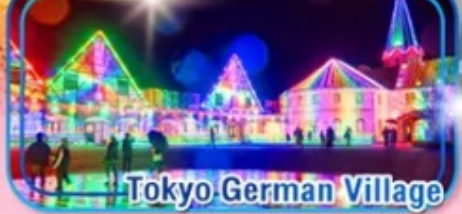
Tokyo German Village