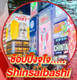
ช้อปปิ้งจุใจ..... Shinsalbashi

โอโห้!! ชมใบไม้เปลี่ยนสีที่สวยงามที่สุดในภูมิภาค ณ หมู่เขาโคริงเค อลังการไฟลันดวง ณ หมู่บ้านนาบะ โนะ ซาโตะ ชม หมู่บ้านมรดกโลกการ์นต์โดย UNESCO ณ หมู่บ้านชิราคาวาโตะ ปราสาทมัตสึโมโตะ เป็น 1 ใน 12 ปราสาทดั้งเดิมที่ยังคงสมบูรณ์และสวยงาม ชมสวนสไตล์ญี่ปุ่น และเยือน วัดกินคะคุจิ หรือ วัดเงิน แห่งเมืองเกียวโต