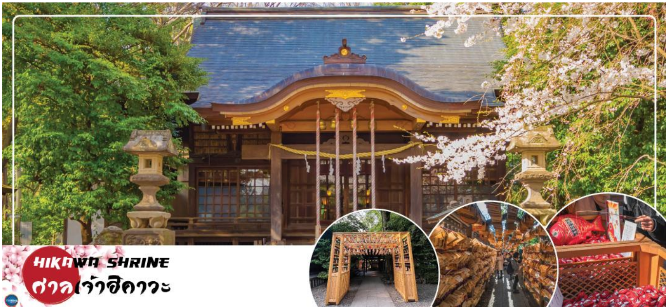
HIKAWA SHRINE ศาลเจ้าฮิกาวะ

จากนั้นนำท่านขอพรความรัก ณ ศาลเจ้าฮิกาวะ (Hikawa Shrine) (จุดชมซากุระขึ้นกับภูมิภาค) เป็นศาลเจ้าที่เชื่อว่าเด็ดยักษ์ เรื่องขอพรความรัก ภายในมี "อุโมงค์เอมะ" เอมะ คือ แผ่นไม้ที่เราเขียนขอพร และนำมาผูกจนกลายเป็นซุ้มคล้ายอุโมงค์ เป็นจุดที่นักท่องเที่ยวนิยมถ่ายรูปทำคอนเทนต์จำนวนมาก นอกจากนี้ สายมูไม่ควรพลาด ท่านยังสามารถซื้อเครื่องรางต่างๆ ที่ไม่ใช่เฉพาะด้านความรัก ยังมี ด้านสุขภาพ ด้านการเงิน การงาน การเรียน เดินทางปลอดภัย และโชคลาภ ก็มีมากมายให้ท่านได้เลือกไว้เป็นของฝากของที่ระลึกอีกด้วย