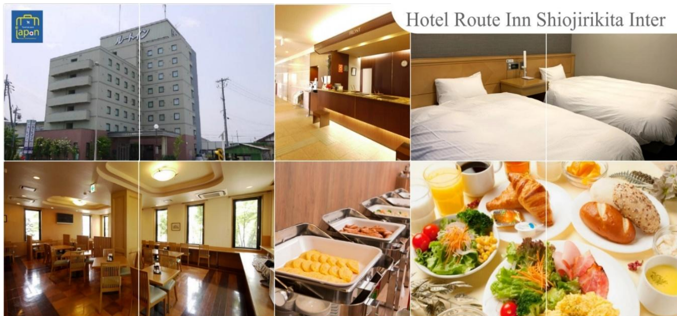
Hotel Route Inn Shiojirikita Inter

พักที่ HOTEL ROUTE-INN SHIOJIRIKITA INTER, MATSUMOTO หรือเทียบเท่าระดับเดียวกัน