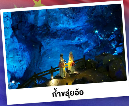
ถ้ำลู่อ้อ

"ดินแดนแห่งสายน้ำและภูเขา" สัมผัสประสบการณ์นั่งบอลลูนชมวิวมุมสูง