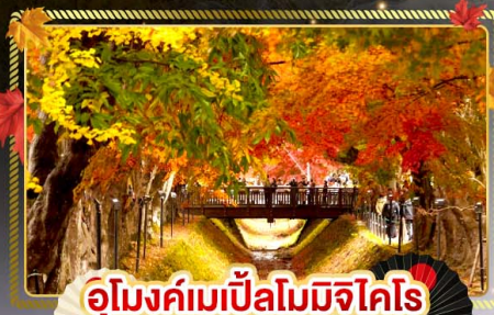
อุโมงค์เมเปิ้ลโมจิโคโร