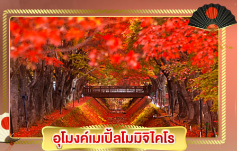
อุโมงค์เมเปิ้ลโมมิจิโคโร