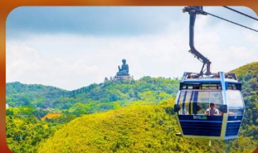
กระเช้านองปิง