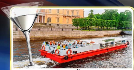
ล่องเรือแม่น้ำวอวา พร้อมลิ้ม Vodka Tasting

📅 เดินทาง : 14-21 มิ.ย.69 / 28 มิ.ย.-05 ก.ค.69 / 24-31 ก.ค.69