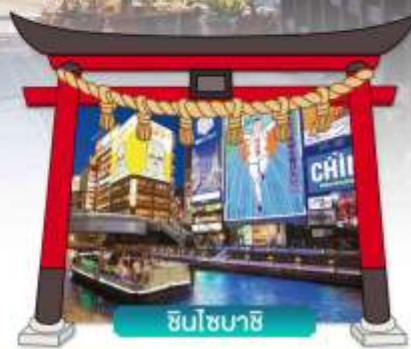
ชินโซบาชิ