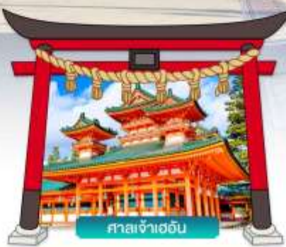
ศาลเจ้าเฮอัน