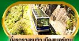
นั่งรถรางชมวิว เมืองเบอร์เกน