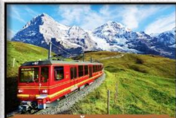
เขา Jungfrau ขึ้นกระเช้า รถไฟ