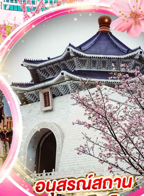
อนุสรณ์สถาน เจียงไคเช็ค