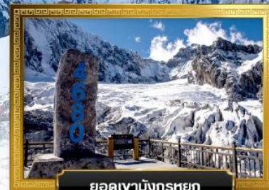
ยอดเขามังกรหยก