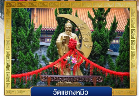
วัดเซกหมีว