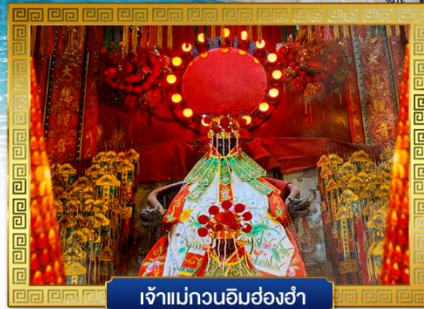
เจ้าแม่กวนอิมฮ่องฮำ