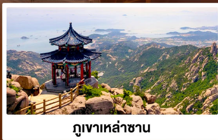
ภูเขาเหล่าซาน