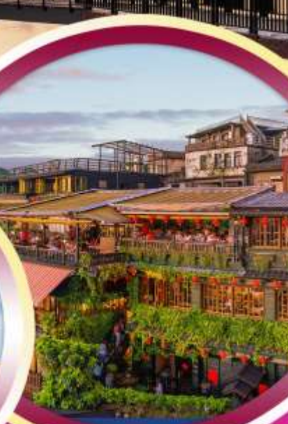
ทะเลสาบสุริยันจันทรา

อุทยานอาลิซาน ล่องเรือทะเลสาบสุริยันจันทรา อนุสรณ์สถานเจียงไคเช็ค วัดหลงซาน