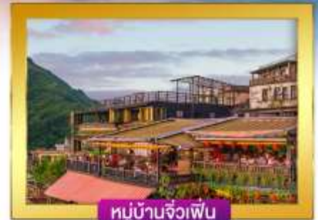
หมู่บ้านจิวเฟิน