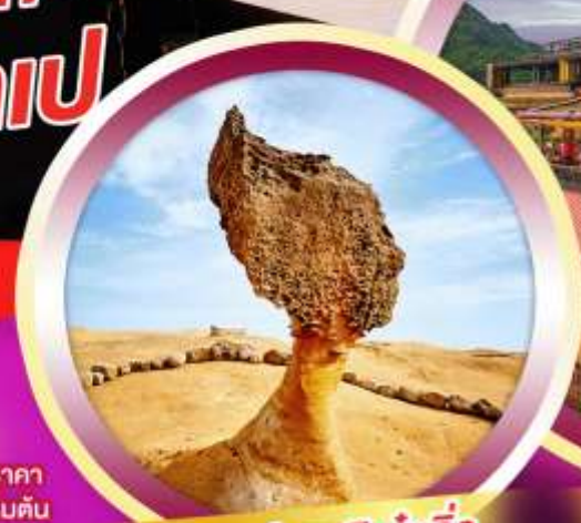
อุทยานแห่งชาติเย่หลิว