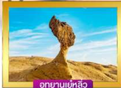
อุทยานเย่หลิว