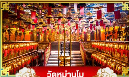
วัดม่านโม

พักกลางวัน "จิมซาร์จ" บินหรือลงเทศกาลปีใหม่ ณ เกาะฮ่องกง