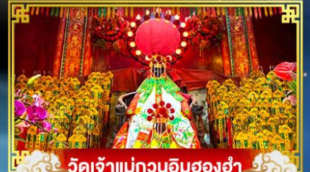
วัดเจ้าแม่กวนอิมสองฮ่า