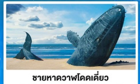
ชายหาดวาฬโดดเดี่ยว