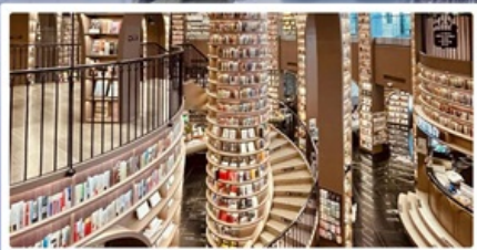
ร้านหนังสือจุงชู่เก๋อ