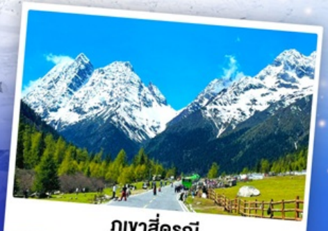
กุเวาสีดรุณี