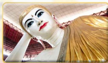
พระนอนตาทาวน์