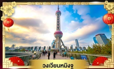
วงเวียนหมิงจู