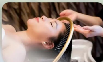
สระพมสโตล์เวียดนาม