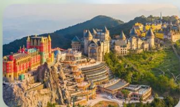
เที่ยวบานาฮิลล์เต็มวัน