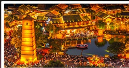
เมืองโบราณลั่วหยี่